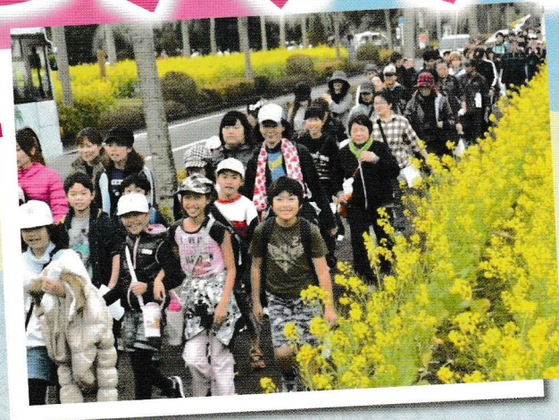
歩こう!!黄色いしゅうたんの中を